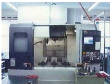
設備の一部 縦型マシニングセンター